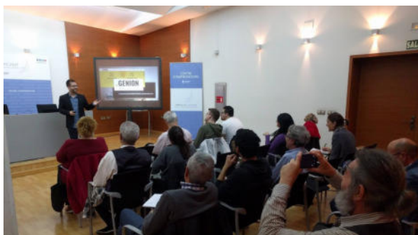
Formación en Agencia de Desarrollo de Alicante