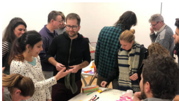
Formación en “Las Cigarreras”, Alicante